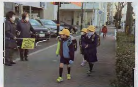
はぐびーさん、いつもありがとうございます!