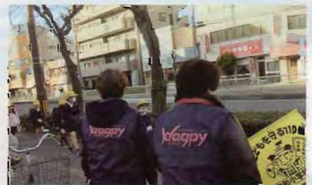
はぐびーさんに見守られ、今更筋沿いを歩きます。

子ども見守り隊「はぐびーさん」にご登録ご希望の方、またお問い合わせは、各町会長さん、または育和小学校(06)6731-1253 担当(教頭先生)まで